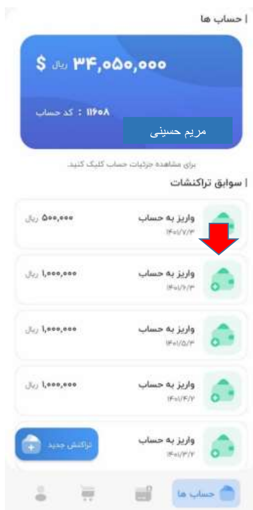
تصویر ۲-۲: صفحه‌ی حساب‌ها و تراکنشات

در این بخش امکان دسترسی به تمامی حساب‌های شخصی و همچنین افراد تحت تکفل وجود دارد. در کادر آبی بالای صفحه موجودی کل، شماره حساب و اسم صاحب حساب نمایش داده شده است و در پایین این کادر تمامی تراکنشات انجام گرفته و تاریخچه آن در دسترس است. در قسمت تراکنشات که در تصویر زیر با فلش قرمز نشان داده شده است برداشت به رنگ قرمز و واریز به رنگ سبز نشان داده شده است.