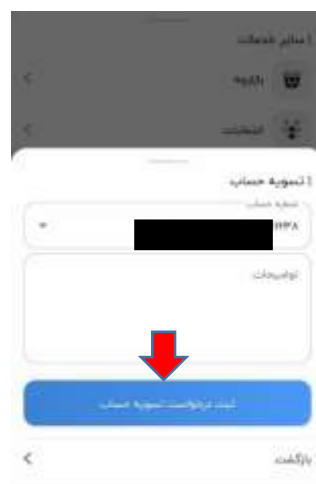
تصویر ۲-۱۲: تسویه حساب

این بخش برای تسویه حساب می باشد. برای تسویه حساب پس از وارد کردن شماره حساب توضیحات لازم برای علت تسویه حساب را نیز وارد می کنیم و سپس درخواست تسویه حساب که با فلش قرمز نشان داده شده است را انتخاب می کنیم.