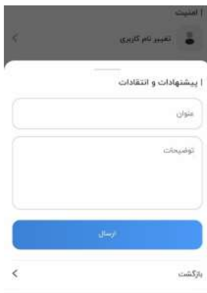
تصویر ۲-۱۶: پیشنهادات و انتقادات

در این قسمت می توانید نظر، پیشنهاد و انتقاد خود را در رابطه با عملکرد صندوق وارد کنید.