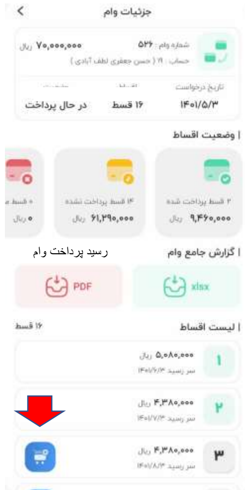
تصویر ۲-۶: جزئیات وام ها