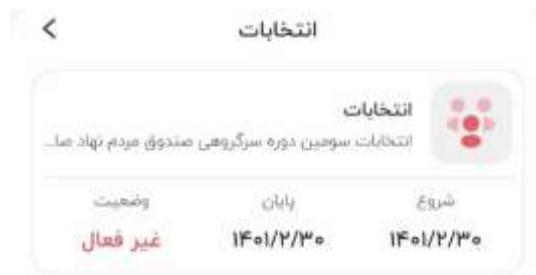
تصویر ۲-۱۱: انتخابات