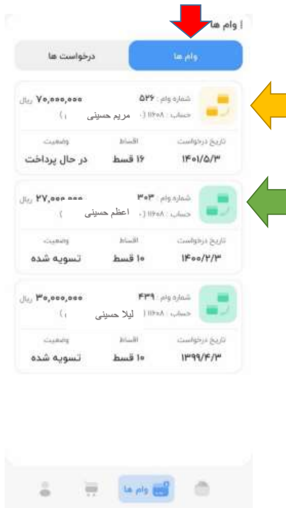
تصویر ۲-۵: صفحه‌ی اقساط و پرداخت وام

اگر هر کدام از وام‌ها را انتخاب کنید می‌توانید جزئیات آن وام را ببینید. در جزئیات هر وام مبلغ وام، تاریخ درخواست وام که همان تاریخ پرداخت می‌باشد، تعداد اقساط و وضعیت وام مشخص شده است. در قسمت وضعیت اقساط نیز تعداد قسط پرداخت شده، تعداد اقساط باقی مانده و تعداد اقساط معوقه مشخص شده است. همچنین می‌توانید با انتخاب فایل‌های گزارش جامع وام همه اقساط را جداگانه و با جزئیات مشاهده کنید. با انتخاب (رسید پرداخت وام) می‌توانید عکس واریز وام به حساب خود را ببینید. در پایین صفحه نیز لیست اقساط قابل مشاهده است. در صورتی که تصویر سبد پرداختی جلوی قسطی باشد به این معنی است که آن قسط هنوز پرداخت نشده است.