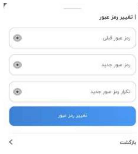
تصویر ۲-۱۴: تغییر رمز عبور

در این قسمت می‌توانید رمز عبور خود را تغییر دهید. با وارد کردن رمز عبور قبلی و وارد کردن رمز عبور جدید و تکرار رمز عبور جدید و انتخاب دکمه تغییر رمز عبور، رمز تغییر می‌کند.