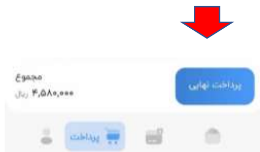
تصویر ۲-۸: صفحه‌ی پرداخت پس‌انداز و اقساط

با انتخاب دکمه پرداخت نهایی، وارد صفحه درگاه پرداخت می‌شوید. در این صفحه مشخصات کارت بانکی خود را وارد می‌کنید و با انتخاب دکمه ((پرداخت)) واریز نهایی به حساب صندوق انجام می‌شود. در این قسمت مبلغ کارمزد نیز به هزینه‌ها اضافه می‌شود. نرخ کارمزد طبق تعرفه شرکت نکست پی یک درصد است که مبلغ حداکثر آن ۸۰۰ تومان می‌باشد.