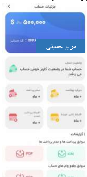
تصویر ۲-۳: جزئیات حساب

اعضا در صورتی می توانند از طرح های ویژه صندوق مثل طرح برداشت موجودی استفاده کنند که جزو کاربران خوش حساب باشند. اگر اعضا جزو کاربران بد حساب باشند امکان گرفتن وام را ندارند تا زمانی که با پرداخت های به موقع به حد مجاز برگردند و جزو کاربران عادی شوند.