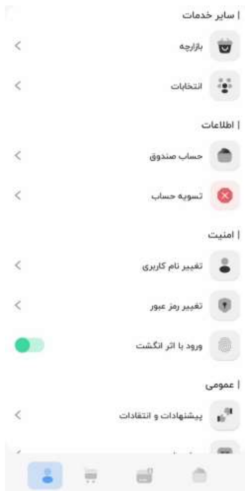
تصویر ۲-۱۰: سایر خدمات